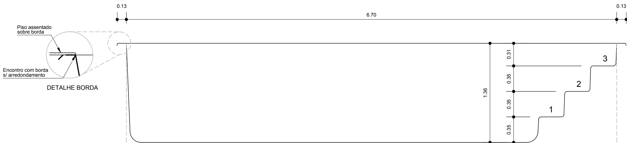
CORTE LONGITUDINAL ESCALA - 1:30